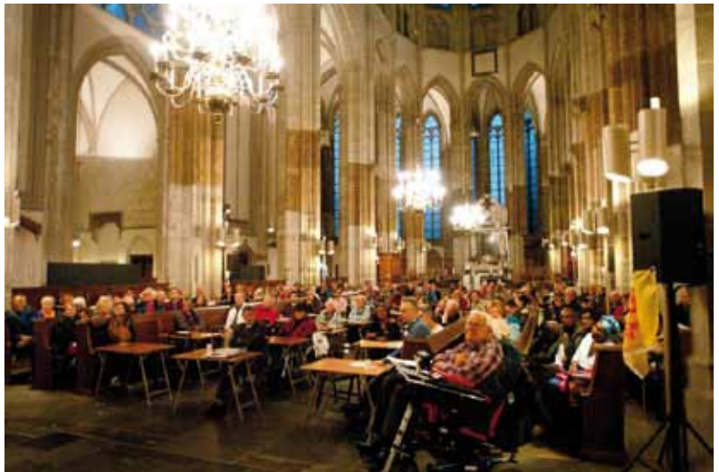
Een domkerk vol tafeltjes met zwoegende deelnemers aan het Kerkdictee

Dat Van Gogh zich had uitgesloofd om moeilijke zinnen en woorden te vinden, bleek wel uit het feit dat er